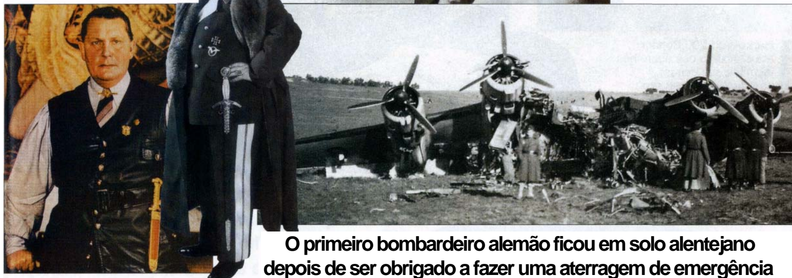
O primeiro bombardeiro alemão ficou em solo alentejano depois de ser obrigado a fazer uma aterragem de emergência

Os aviões alemães aliavam a capacidade de voos de longa distância a um forte poder de fogo