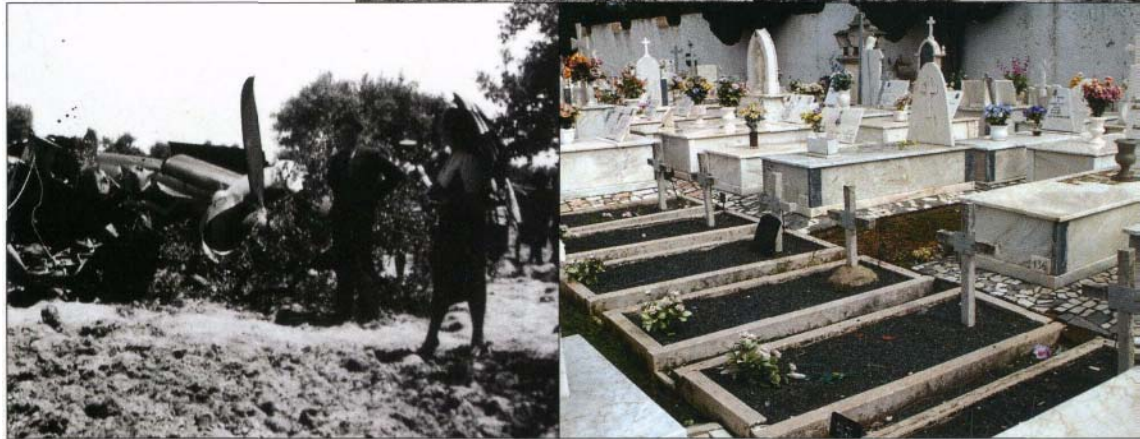
Sepulturas da tripulação do avião abatido em Aljezur