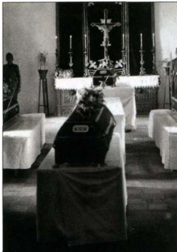
Os corpos dos aviadores, que morreram na queda de 15 de Julho, estiveram em câmara ardente

Destroços do bombardeiro que se despenhou a 15 de Julho. Os seis membros da tripulação morreram