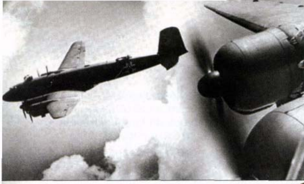
Focke-Wulf 200 Condor era o modelo dos aparelhos alemães que caíram no Alentejo, depois dos combates com os aliados nos céus de Moura