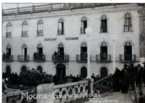
A tripulação do bombardeiro, que foi forçado a uma aterragem de emergência no Alentejo, foi hospedada no Grande Hotel, de Moura até desaparecer

O capitão da GNR de Beja informou o Comando-Geral da corporação, em Lisboa,